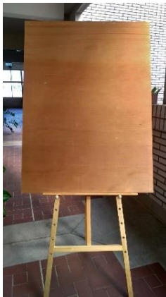
圖 1 硬式展示板